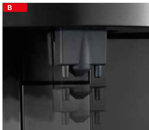
becco erogatore regolabile adjustable wand