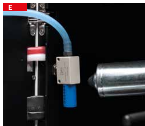
regolatore densità latte milk density regulator