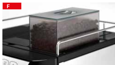
extra-sylos caffè extra coffee container