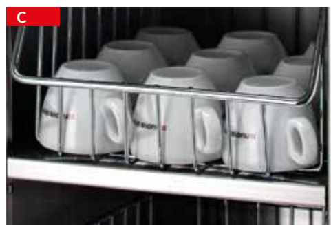
scaldatazze cup warmer