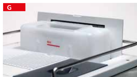
tanica da 5lt o attacco diretto 5Lt tank or mains connection