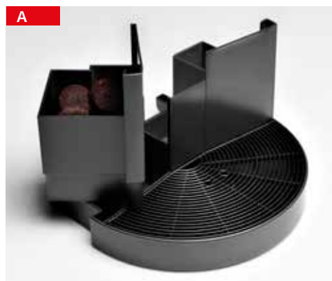
cassetto raccogli fondi grounds container

VERSATILITY AND FUNCTIONALITY VERSATILITÉ ET FONCTIONNALITÉ