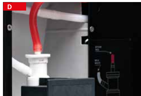
cappuccinatore incorporato in-built cappuccino maker